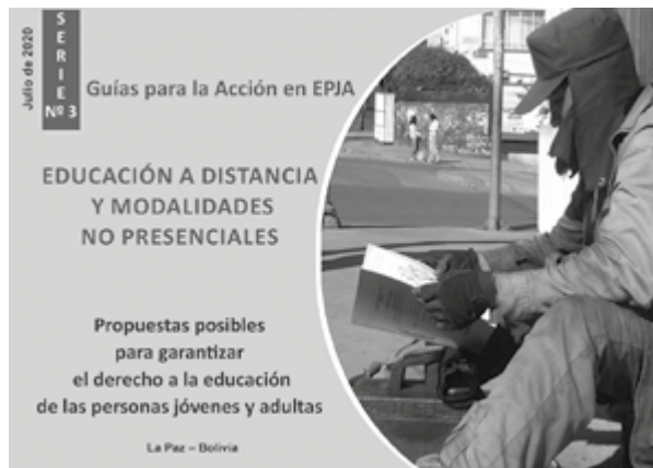
Fotografía: Portada del núm. 3 de la serie Guías para la acción en EPJA, La Paz (Bolivia), IBAP/F-DYAP

educativos para su trabajo con los participantes adultos de los centros educativos.