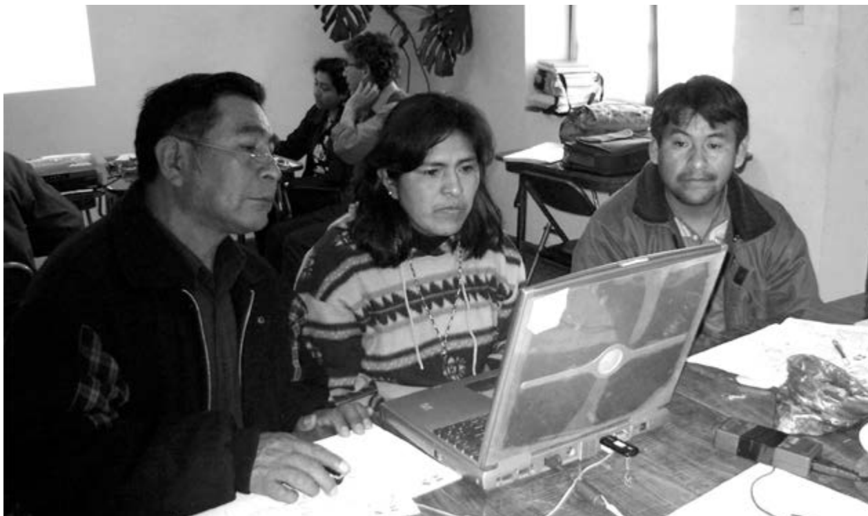
Fotograma: Fundación DYAP (2020), Contexto de crisis sanitaria y EPIA . [YouTube]. https://www.youtube.com/watch?v=jqfKpK0G-ol