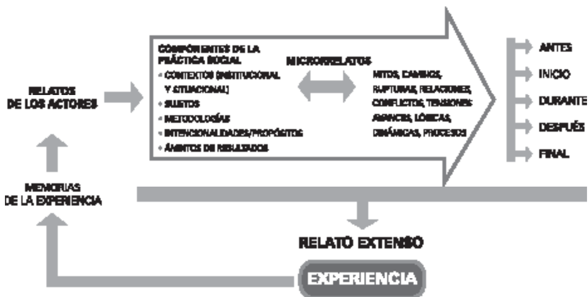
Figura 2. Ruta de reconstrucción

En resumen, en un proceso de sistematización es necesario que la reconstrucción de la experiencia contemple diferentes pasos que se interrelacionan y otorgan una visión general y específica de ésta.