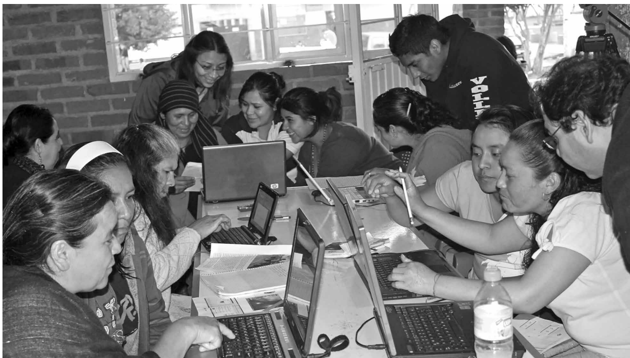
Fotografía: Armando Guzmán. Proyecto Más que Computadoras.